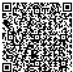
ดาวโหลดแบบฟอร์มต่างๆ

A: การขอรับการรับรองระบบการจัดการจาก สถาบันรับรองมาตรฐานไอเอสโอ สามารถ ประสานงานมาที่สถาบันฯ ผ่านช่องทางต่างๆ เช่น Website, Line official, Facebook หรือโทรศัพท์ ติดต่อโดยตรงมาที่สถาบันฯ